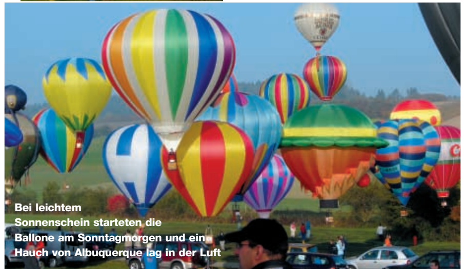
Bei leichtem Sonnenschein starteten die Ballone am Sonntagmorgen und ein Hauch von Albuquerque lag in der Luft

/// Viel Zeit zum Schlafen blieb den Teilnehmern in der Nacht von Samstag auf Sonntag nicht: 6.00 Uhr Gastanken, 6.30 Uhr Frühstück